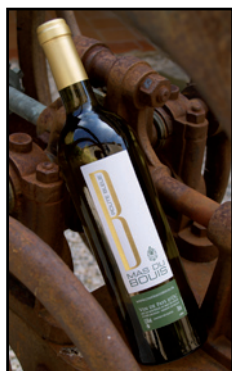
VIN DE PAYS D'OC