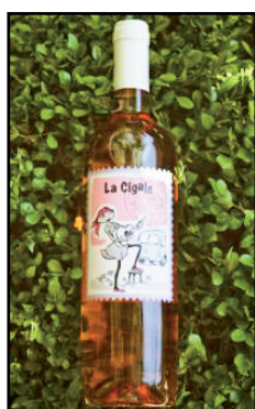
PAYS D'OC IGP