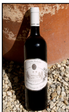
VIN DE PAYS D'OC